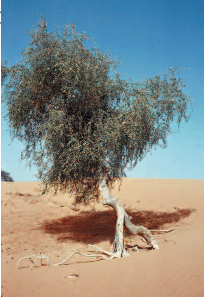
Balanites aegyptiaca déchaussé par le vent (nord du Sénégal).

Depuis les années 1980, de nombreuses expérimentations menées en Afrique cherchent à comprendre et à mieux caractériser les liens entre pertes en nutriments et pertes en productivité des sols 3 . En Éthiopie, par exemple, l'évaluation de l'impact de la perte en nutriments sur la productivité des sols repose sur la mise en œuvre d'un protocole expérimental concret au niveau des exploitations agricoles : le rendement des deux principales céréales