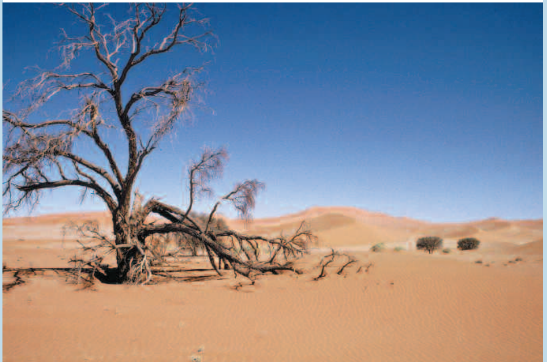
Acacia erioloba affecté par les sécheresses successives (désert du Namib, Namibie).

Pour le continent africain , les études concrètes sur le coût de la dégradation des terres à l'échelle nationale sont rares et peu référencées. Divers travaux recensés depuis les années 1980 sont présentés ici – méthodes, limites, résultats. Globalement, ils se différencient en deux types d'approches : des modélisations en majorité centrées sur la compréhension des processus d'érosion pluviale, faites à partir de relevés parcellaires ; des approches plus spatiales qui regroupent les surfaces affectées en fonction des principales activités économiques qui s'y déroulent.