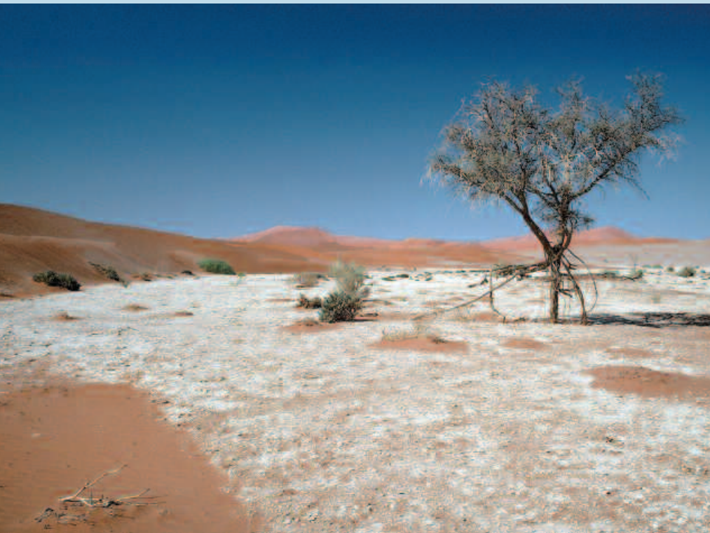
Remontée de sel dans une dépression (désert du Namib, Namibie).

Dans de nombreux pays, le manque de données, qu'elles soient disséminées dans diverses institutions ou simplement indisponibles, empêche souvent de réaliser de telles évaluations des coûts de la désertification et de la dégradation des terres. Des combinaisons diverses de données environnementales et agro-économiques sont alors observables : en Tunisie, les évaluations nationales des surfaces en terres qui sont perdues chaque année distinguent les surfaces irriguées et celles en culture pluviale ; il est alors possible de calculer la perte économique en céréales, à partir des rendements moyens de ces terres et du prix international du blé (BANQUE MONDIALE, 2003 b). Au Rwanda, l'évaluation de la dégradation des terres s'appuie sur le calcul de la baisse de la productivité par tête entre 1982 et 1994 pour les céréales et les tubercules, obtenue par le croisement de recherches menées au niveau local et de don-