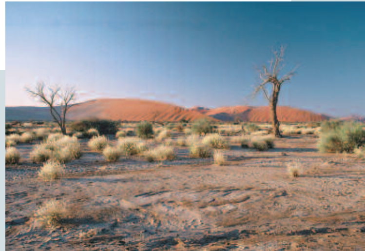
Conséquence des sécheresses successives dans le désert du Namib (Namibie) : la végétation arborée subsiste sous la forme d'arbres morts ou dépérissants.

La lutte contre la désertification est donc indissociable de la question du développement durable des zones arides et semi-arides.