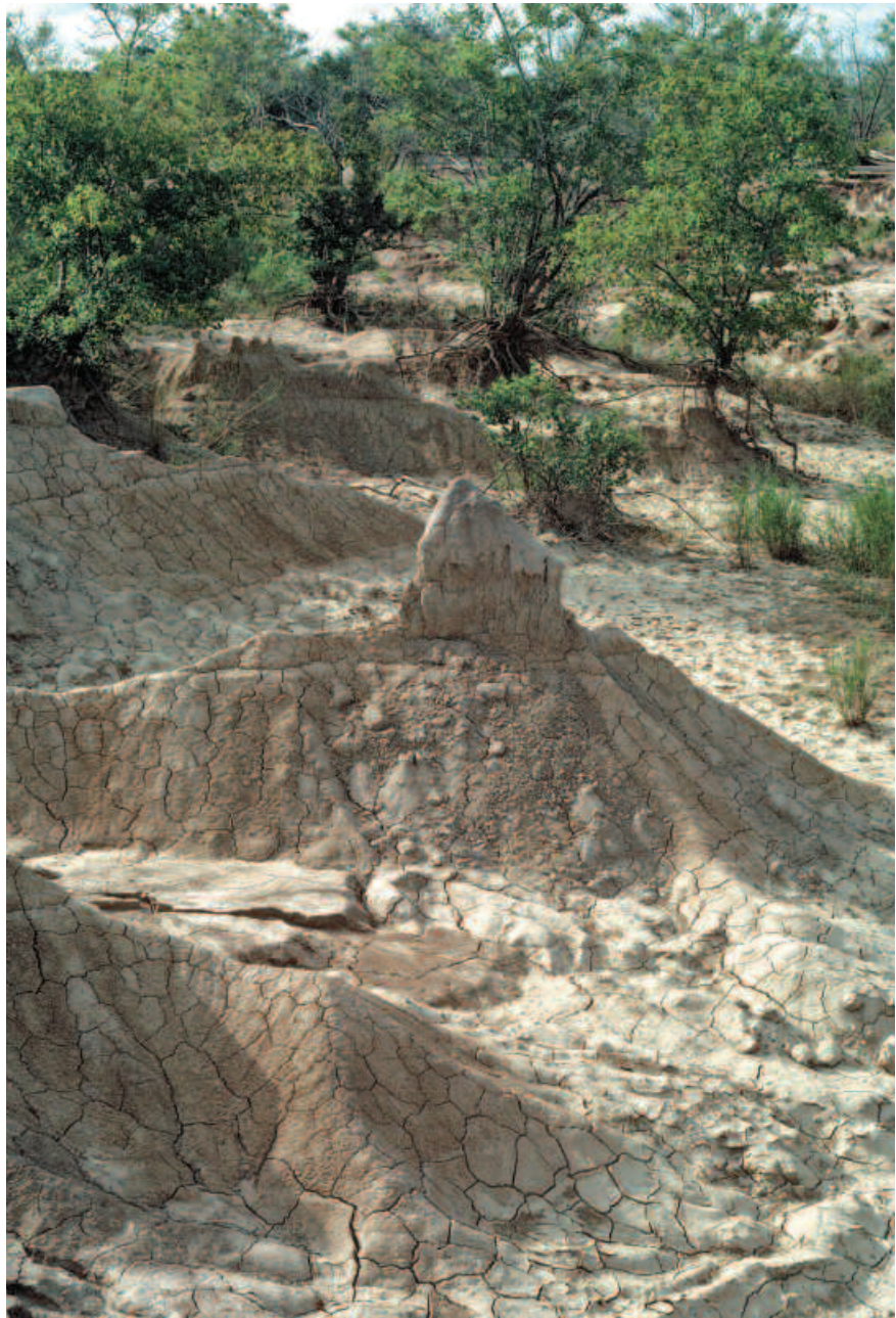
Cirque d'érosion dans la plaine alluviale du fleuve Comoé (Côte d'Ivoire) affectant le maintien de la végétation arborée à Mitragyna inermis .

Il y a également tout un champ de recherche nouveau à développer concernant les méthodes d'évaluation des pertes économiques, sociales et environnementales dues à la dégradation des terres et des pertes de l'ensemble des services rendus par les écosystèmes des zones sèches.