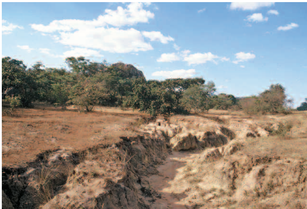
Ravine d'érosion due à l'action combinée du surpâturage et du ruissellement (Zimbabwe).

Il existe de nombreux travaux de modélisation des phénomènes d'érosion qui remontent au début des années 1960. La référence en amont de la plupart de ces recherches est l'Équation universelle des pertes en sols (Eupt ou Usle en anglais) (HILBORN, STONE, 2000). Elle permet d'estimer la perte en terre ou le taux annuel moyen d'érosion à long terme sur la pente d'un champ : ce taux exprimé en tonnes par acre résulte de la configuration des pluies, du type de sol, de la topographie, de l'assolement et des pratiques de gestion des cultures. L'Eupt est donc un modèle de prévision et d'analyse de l'érosion qui concerne surtout les sols cultivés. Ses développements sont nombreux, de la formulation d'équations alternatives des pertes en sols à la modélisation des liens entre la perte en sols, la perte en nutriments des sols, et celle en productivité, ce qui permet de calculer le coût économique de l'érosion.