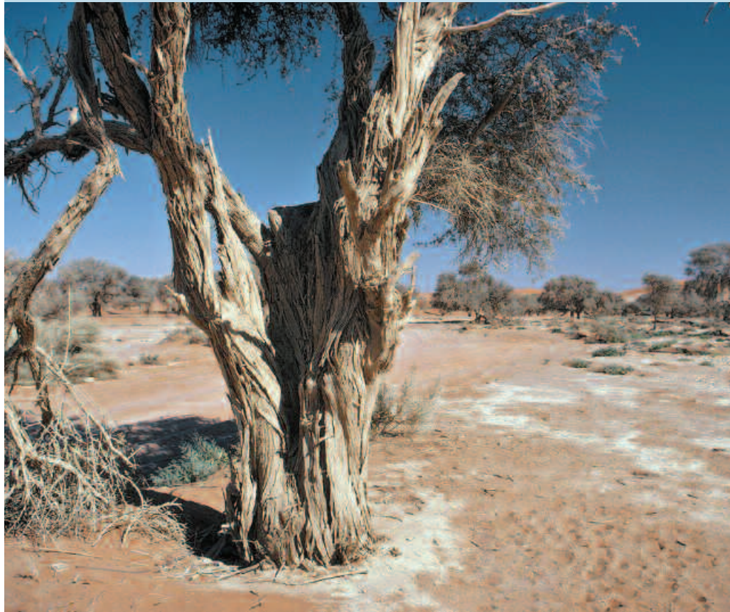
Acacia erioloba affecté par la sécheresse et la remontée de sel dans une dépression (désert du Namib, Namibie).

Ces évaluations font appel aux services de la télédétection ou des bases de données nationales sur l'évolution de la dégradation, sur les