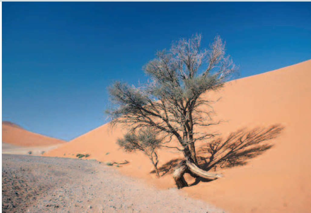
Acacia erioloba survivant en bordure d'une dépression envahie par la progression du sable.

L'accroissement de la pauvreté et des inégalités en milieu rural dans les régions arides et semi-arides et les implications nationales et internationales de cette évolution font de la lutte contre la désertification une cause planétaire. Il convient donc qu'une action concertée soit mise en œuvre sur le plan mondial. Tous les efforts doivent converger : locaux, nationaux, internationaux. Il s'agirait de considérer que la Lcd puisse être labellisée « bien public mondial » regroupant l'ensemble des techniques de lutte, les incitations à leur mise en œuvre collective, l'appui aux populations les plus démunies, la sécurité alimentaire et l'élimination de la pauvreté. La Lcd deviendrait alors un ensemble de biens, de pratiques, de conditions, d'informations et de connaissances, qui impliquerait une réorganisa-